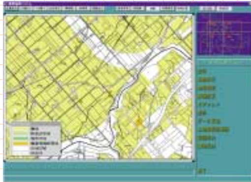
土地利用現況図 地番図 農振計画図 等高線 オルソフォト画像

各種ベクトルデータとラスターデータを任意に組み合わせて表示することにより目的に応じた詳細な土地に関する利用状況を把握することができます。