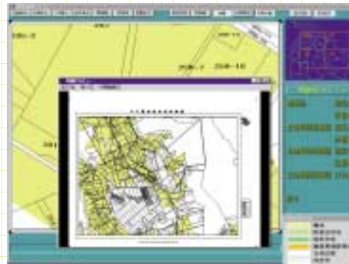
地番図( 1/5,000 ) 土地利用現況図( 1/5,000 ) 土地利用計画図( 1/5,000・1/50,000 )

整備計画及び土地利用に関する各種図面を出力することができます。さらに、除外・編入申請に必要な添付図面の出力も可能です。